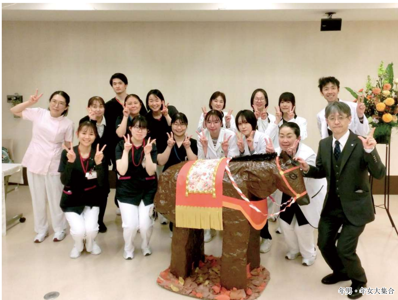
年男・年女大集合