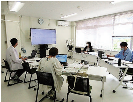
研修室での演習風景

特定行為研修を受講する中で、研修生が特に奮闘しているのが演習です。演習は、症例をベースとしたペーパーシミュレーションで、e-ラーニングで学んだ内容を基に、指導者のもとで議論や発表を行います。研修生は、演習に臨むにあたって調べ、考え、研修生同士で話し合い、問いに対する解答を準備します。その結果、演習では指導者の先生方によるファシリテーション（進行、支援、まとめなど）と研修生の発表により、活発なディスカッションが行われています。