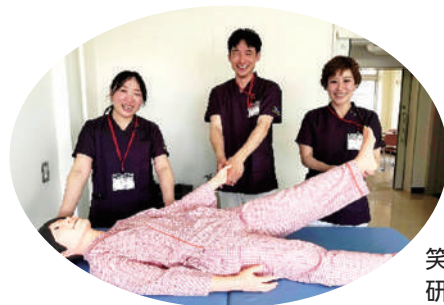
笑顔の素敵な研修生