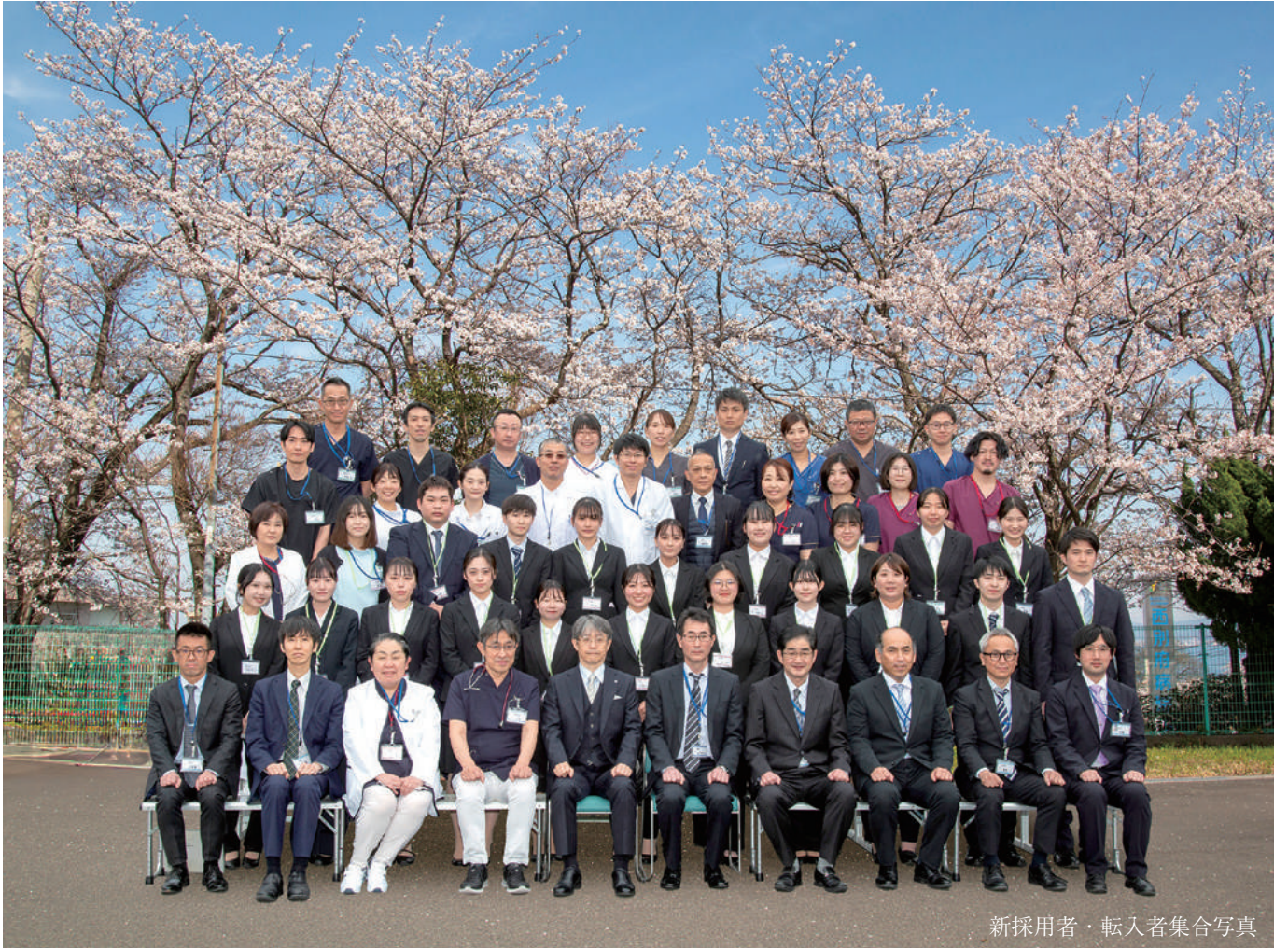
新採用者・転入者集合写真