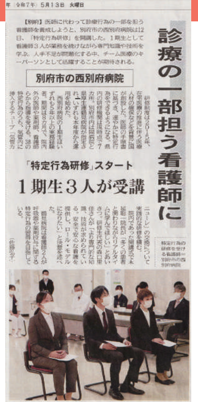
令和7年5月13日 大分合同新聞

令和7年5月12日に行われた特定行為研修の開講式は、大分合同新聞と今日新聞に1期生3名の晴れ姿と共に紹介されました。特定行為研修は、研修2週間と勤務2週間を繰り返しながら、8ヶ月間行います。e-ラーニングによる講義、演習、実習があり、医師11名、薬剤師5名、看護師2名の合計18名の多くの指導者のもとで行っています。