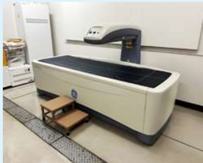
全身X線骨密度測定装置：PRODIGY Fuga (GE社製)

原発性骨粗鬆症ガイドライン2012年改訂版に基づき、日本人男女の原発性骨粗鬆症診断基準が改定され、新