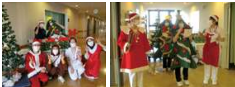
東1・2・5病棟クリスマス会

カルライトダンス”を披露しました。ダンスが始まると大声で笑ったり、驚いたりする様子が見られました。その後、引換券とヒュッテに飾られたプレゼントを交換し、最後にハンドベル演奏を行いました。未就学児さんの会では、絵本“100人のサンタクロース”の世界観で行いました。事前にサンタ宛の手紙を書き、“返事が来た！サンタの町に招待された！”という設定でスタート。絵本のお話にちなんだサンタ探しゲームでは、「見つけた！」とお友達や職員と喜びながら楽しみました。ジングルベルを歌っていると、サンタさんが登場！ご家族からのプレゼントをもらい、とても嬉しい会となりました。