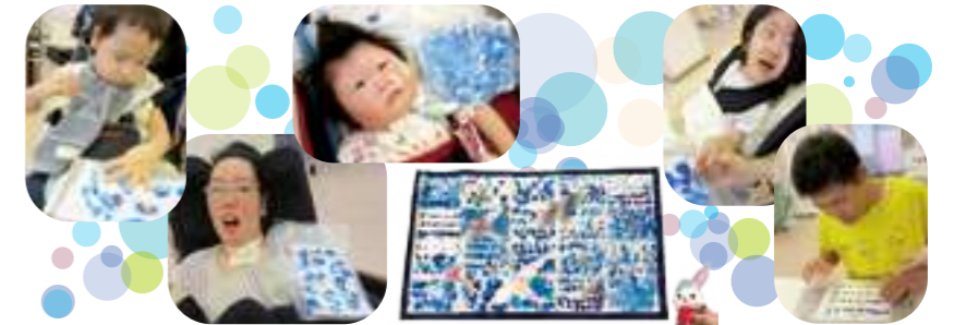
※写真の掲載につきましては利用者さんのご家族の了承を得ております。