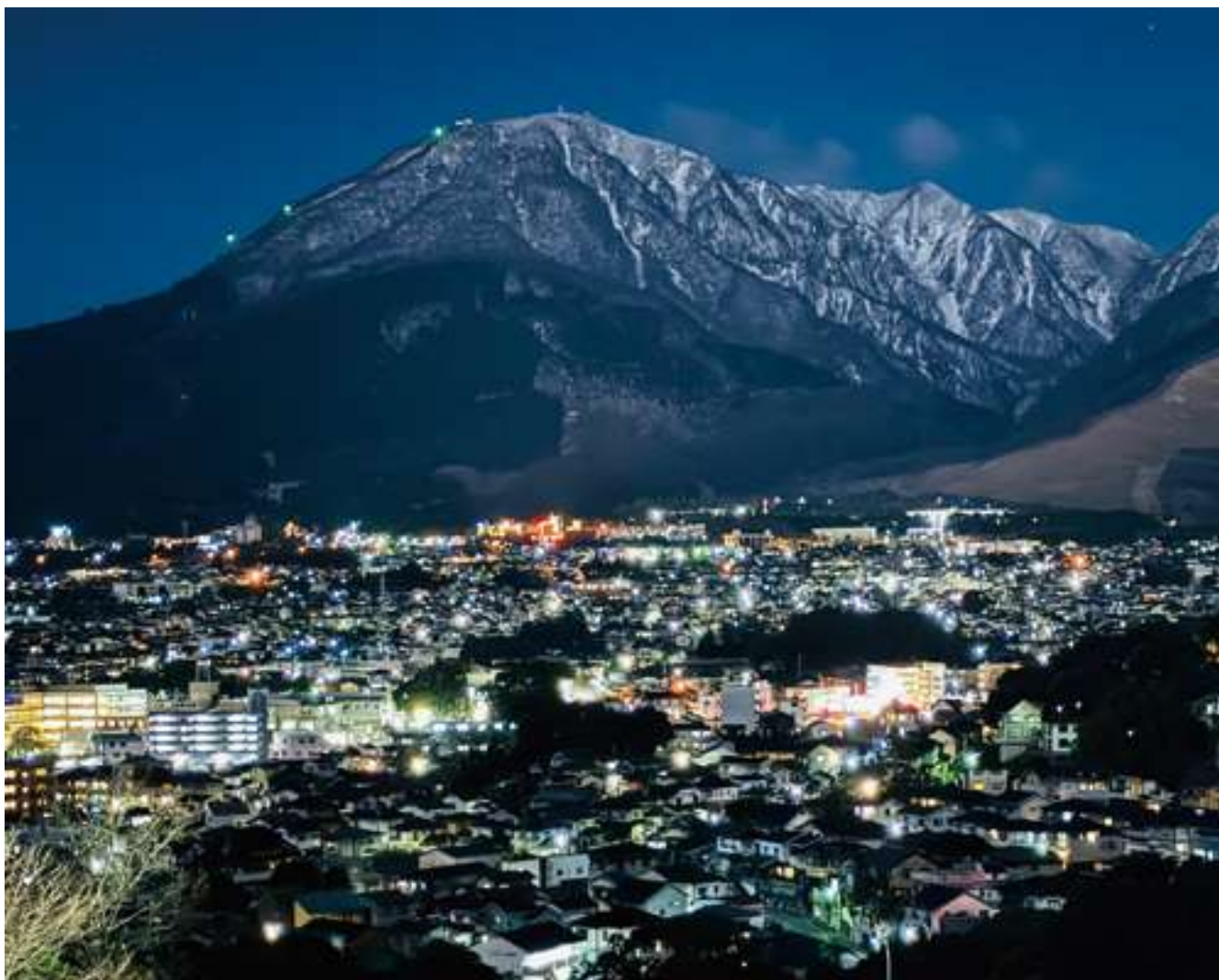
仏舎利塔から臨む鶴見岳