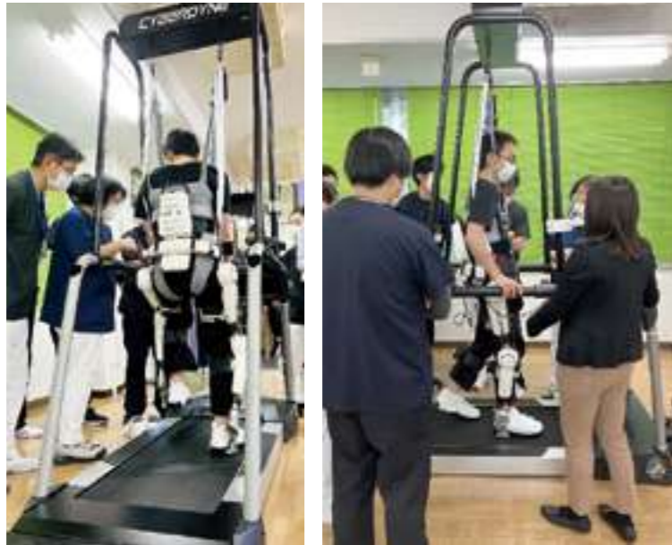
導入のための安全講習会の様子

進行性の神経筋疾患、いわゆる神経難病においても近年の治療の開発・進歩はめざましいものがあります。薬剤での治療も重要ですがリハビリテーションは身体機能の維持・改善に不可欠であり、より有効性の高い治療としてHALに期待しています。已年を迎え、HALとともに脱皮、成長していきましょう！