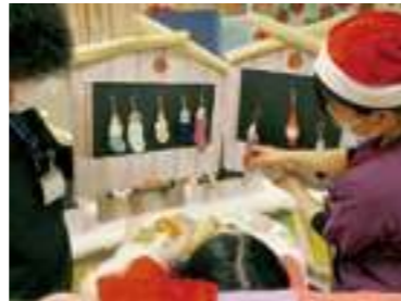
東3・4病棟クリスマス会

東3・4（主に重症心身障害）病棟では、未就学児以外の方に昨年好評だった“X'masマーケット”に参加していただきました。イルミネーションと「べっぴんクリスマスファンタジア」の映像を鑑賞後、職員が“ケミ