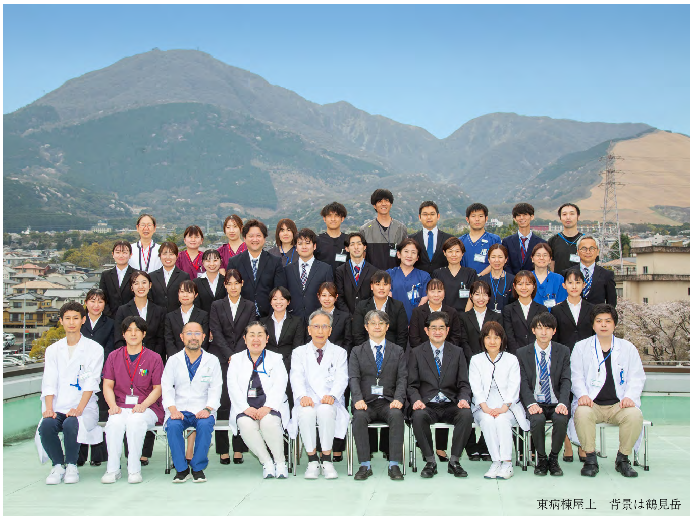
東病棟屋上 背景は鶴見岳