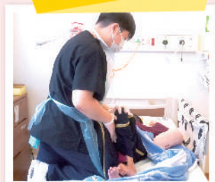
ベッドサイドリハビリ

機能維持・改善だけでなく心理面でも効果は大きく、患者満足度の向上につながっています