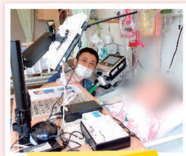
意思伝達装置の支援

発語困難な患者さんにコミュニケーションツールの検討、試験的利用から導入まで支援しています