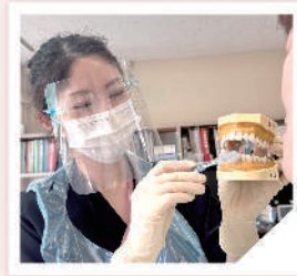
歯科衛生士の 口腔指導

全国的にも歯科医師が常勤している病院はとも も少ないです。歯科治療はもちろんのこと、予防 にも関わっており、食事が可能な方でも困難な方 でも口腔環境の改善を行っています。