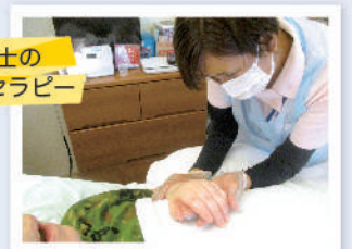
保育士の アロマセラピー