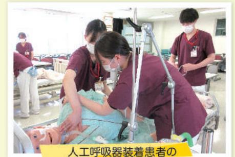
人工呼吸器装着患者の 看護研修

診療科として、小児科、小児精神科、呼吸器科、循環器科、消化器科、神経内科、一般外科、脳神経外科、生殖・遺伝科、リハビリテーション科、放射線科、歯科などがあり、幅広いアプローチで診療を行っております。小児科・神経内科専門医に加えて、てんかん学会専門医、臨床神経生理学学会専門医、日本人類遺伝学会臨床遺伝専門医など高い専門性を有した医師が勤務しており、遺伝子診断を視野に入れた遺伝カウンセリング、脳波検査・神経伝導検査などの神経生理検査、MRI・CT・超音波検査などの画像診断、内視鏡検査なども行っています。リハビリテーションでは心臓リハビリや呼吸器リハビリも行っています。医師とともに、認定看護師や重症心身障害看護師などを中心とした専門性の高い看護師、リハビリテーションスタッフ、臨床工学技士などの医療職が質の高い医療サービスの提供を行っております。