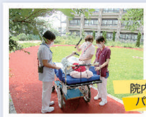
院内ヒーリング パークへ散歩

障害福祉サービスは、年齢に応じて療養介護と医療型障害児入所 （指定発達支援医療機関）とに分けられます。