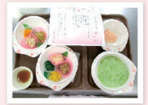
お花見御膳 形態調整食 (押しつぶし)