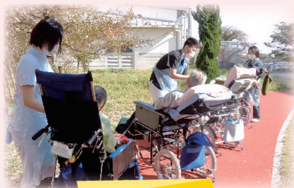
積極的離床アプローチ