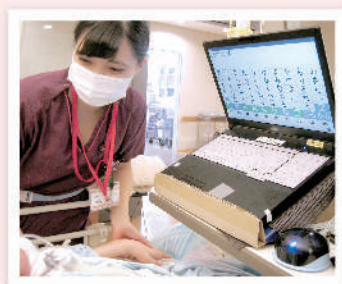
意思伝達装置（伝の心）を利用したコミュニケーション

患者さんやご家族の変化する思いに応えられるように、病棟スタッフ、医療ソーシャルワーカー、療育指導室などが協働して取り組んでいます。入院から在宅への導入支援も行っています。緩和ケア認定看護師を含めた緩和ケアチームが活動しており、非癌患者さんに対しても意思決定支援やQOLの向上に取り組んでいます。