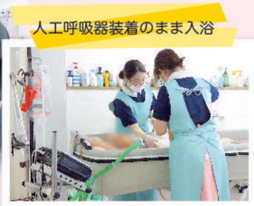
人工呼吸器装着のまま入浴