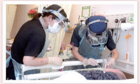
歯科医師と歯科衛生士 による歯科診療