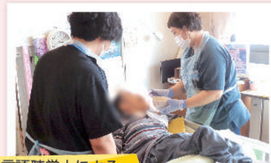
言語聴覚士による 摂食嚥下訓練